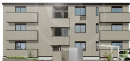
完成予想図につき実際とは多少異なる場合がございます。